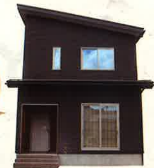
実家のとなりに新築しました