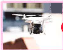
ドローンで点検いたします