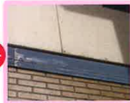
外壁の点検・コーキングもチェック!