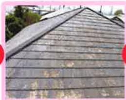
普段見えない屋根もはっきり見えます!