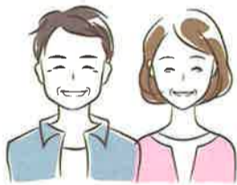
上越市在住Aさまご家族

何から始めて良いのか全く分からなかったの、ネットで情報を集めたり、折込チラシで情報を収集しました。その中で、興味を持った住宅会社さんの完成見学会へ参加しました。 実際に、完成見学会に参加して、とても驚かされました。同じ間取りの家は一つもなく、それぞれの建てた方の考え方、ライフスタイルのこだわりが反映されているのが、素人の私たちにも伝わってきました。現実的な家だったかもしれませんが、建てた方のこだわりのポイントがそれぞれ違って