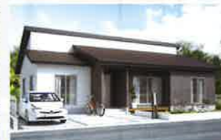
軽井沢の家 ラグジュアリー