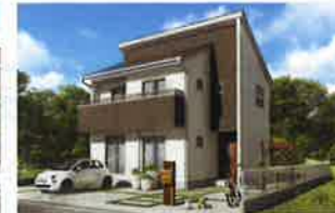
パパまる はぴママ

素敵に快適になるような、ちょっとしたアイデアを頑張るママの笑顔のために作りました。