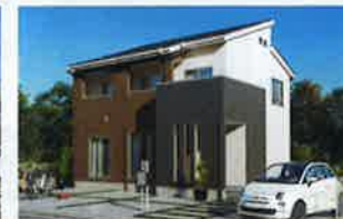
パパまる ハイスタイル

ビジュアルに刺激する洗練されたデザインがクールに際立つスタイルにこだわるデザイン住宅。