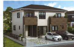
パパまる ベーシック

シンプルな暮らし方、本来の家らしさを追求した屋根裏収納のないベーシックなプラン。