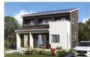
パパまる カラフル