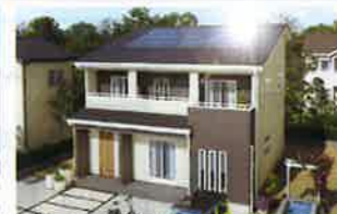
パパまる サン・ステージ

パパまるハウスの太陽光発電住宅。持続可能な「安心のライフステージ」を目指しました。