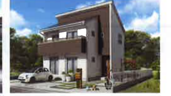
パパまる はぴママ

素敵に快適になるような、ちょっとしたアイデアを頑張るママの笑顔のために作りました。