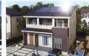
パパまる サン・ステージ

パパまるハウスの太陽光発電住宅。持続可能な「安心のライフステージ」を目指しました。