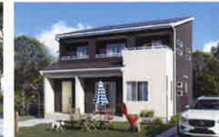
パパまる カラフル