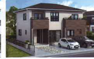
パパまる はぴママ

シンプルで暮らし方、本来の家らしさを追求した屋根裏収納のないベーシックなプラン。