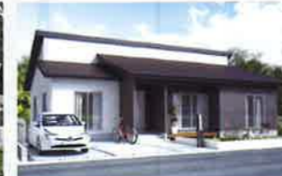
軽井沢の家 ラグジュアリー