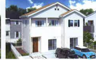
パパまる ベーシック