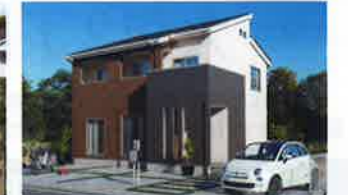
パパまる ハイスタイル

ビジュアルに刺激される洗練されたデザインがクールに際立つスタイルにこだわるデザイン住宅。