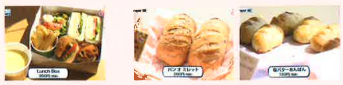
Lunch Box REGINA sweets&bakery

はるてらすを撮影スタジオに4月にJCVのすまいるoneで放送された上越で人気のパン屋さんをご紹介します！