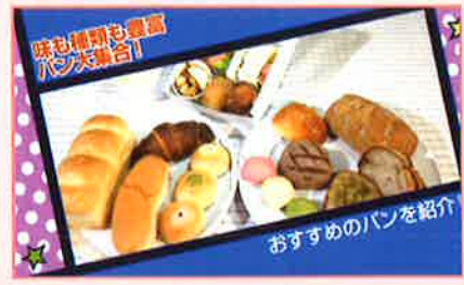
パンオミレット・塩バターあんぱん Boulangier M