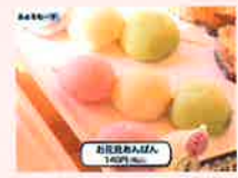
お花見あんぱん・チョコチップめろん ぱん工房ふおるもーず