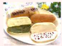
宇治抹茶クリームサンドパン 小竹製菓