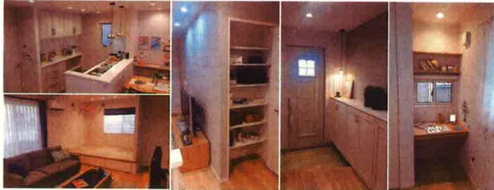
内観写真：平成30年8月撮影

■セキュレア春日山町全体概要●交通/えちごトキめき鉄道妙高はなうまライン「春日山」駅より徒歩11分●総区画数/2区画●用途地域/第一種中高層住居専用地域●地目/宅地●建ぺい率/60%●容積率/200%●道路の幅員/7.56mアスファルト舗装●設備等の概要/電気：東北電力(他の小売電気事業者の選択も可能です)、ガス：都市ガス、水道：市営水道、下水：公共下水道●手付金等の保全措置/西日本住宅産業信用保証株式会社●取引態様/売主：大和ハウス工業株式会社●取引条件有効期限/令和元年9月30日●広告作成年月日/令和元年8月20日 ■分譲住宅概要●所在地/新潟県上越市春日山町2丁目1647番5●今回販売戸数/1戸●区画面積/165.34㎡●私道負担/なし●建物面積/106.08㎡●建物構造/軽鉄骨造2階建●建築確認番号/第ERI-18019405号●販売価格(税込)/3,200万円●完成年月/平成30年8月完成済●入居予定/即入居可