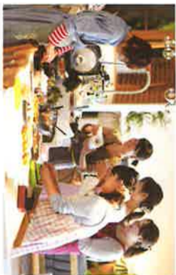
ワークショップに参加！