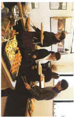
からだに優しいパンが買える！