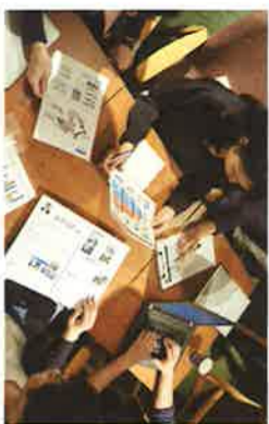
おうちづくりの相談！